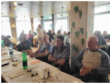
Abbildung 1 anwesend waren 40 Mitglieder und 8 Gäste