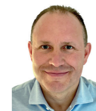
Martin Sieber Werbung